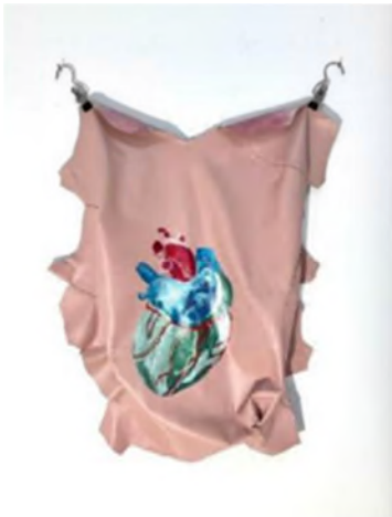
Klodin Erb, Herzkammer #12 , 2023, Michaela Allemann, Studie für Installation im Äbtekeller, Scriptum est , 2024