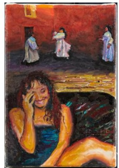
Lukas Salzmann, Was wäre Wenn #7 , 2023