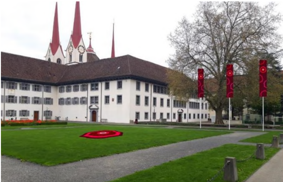
Brigitt Bürgi, Skizze Venusquelle und Venusfahnen , 2024, Klosterhof Muri