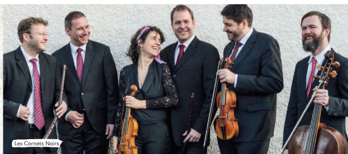
Les Cornets Noirs

«1854» im Flur der Gemein- deverwaltung. Sie themati- siert echte Freiämter Aus- wandererschicksale und ist vom 22. Juli bis 15. Septem- ber 2023 frei zugänglich (Gemeinde-Öffnungszeiten).