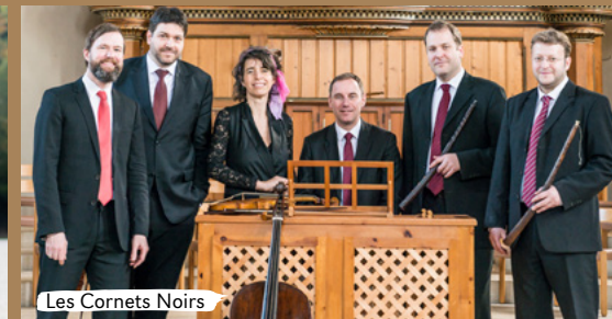
Les Cornets Noirs