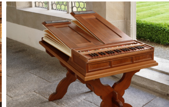
v.o.l.n.u.r.: Grosse Orgel, Chorpositiv, Regal, Spieltisch Evangelienorgel, Spieltisch grosse Orgel, Spieltisch Epistelorgel