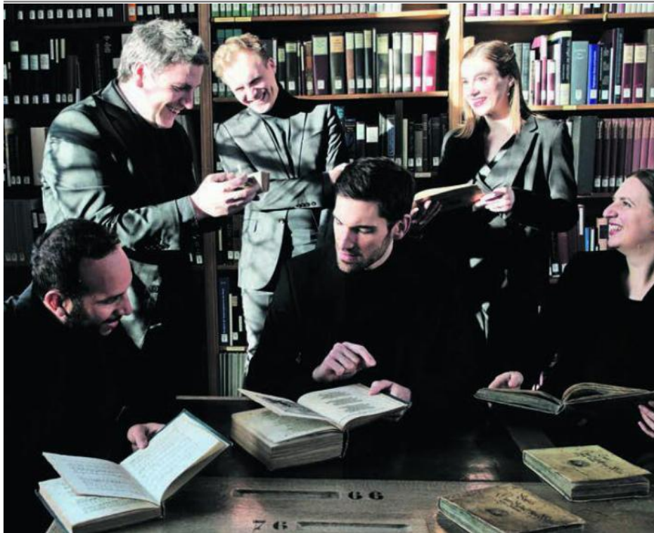
Wer Lamaraviglia vor und hinter der Bühne erlebt hat, weiss, hier flirrt eine Menge positiver Energie durch den Raum. Von Schwiizerdütsch, Deutsch, Französisch, Brasilianisch, Englisch bis Italienisch – hier treffen Sprachen und Kulturen aufeinander.