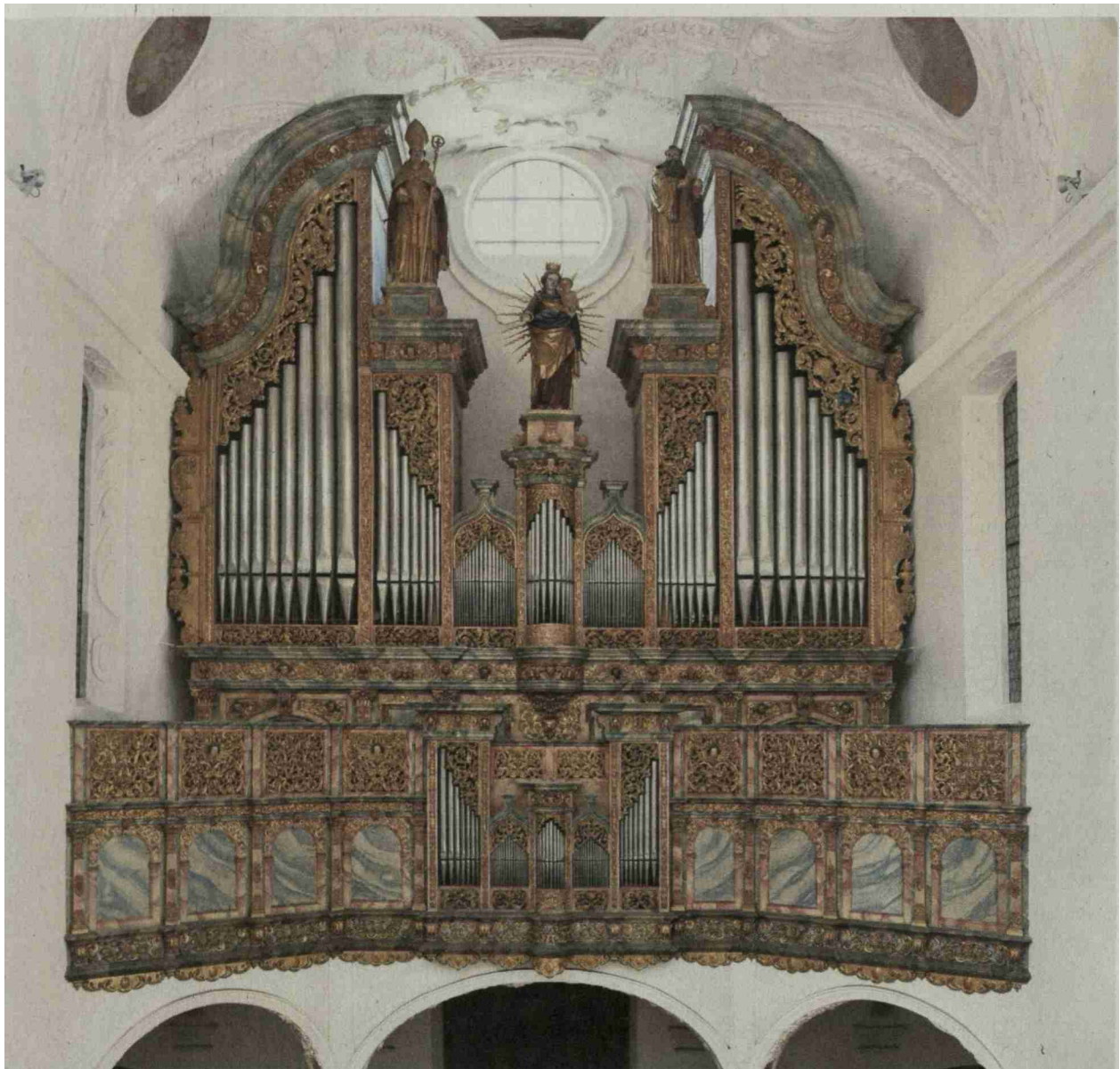
Die Grosse Orgel der Klosterkirche Muri ist noch der Renaissance verpflichtet.