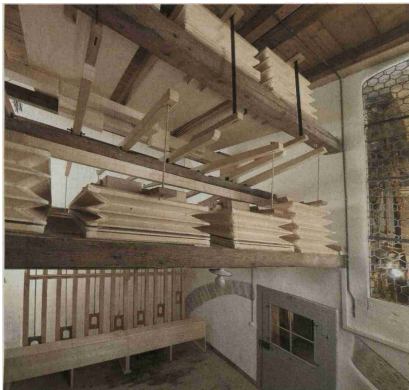
Die rekonstruierten Bossart'schen Balganlagen in Muri.