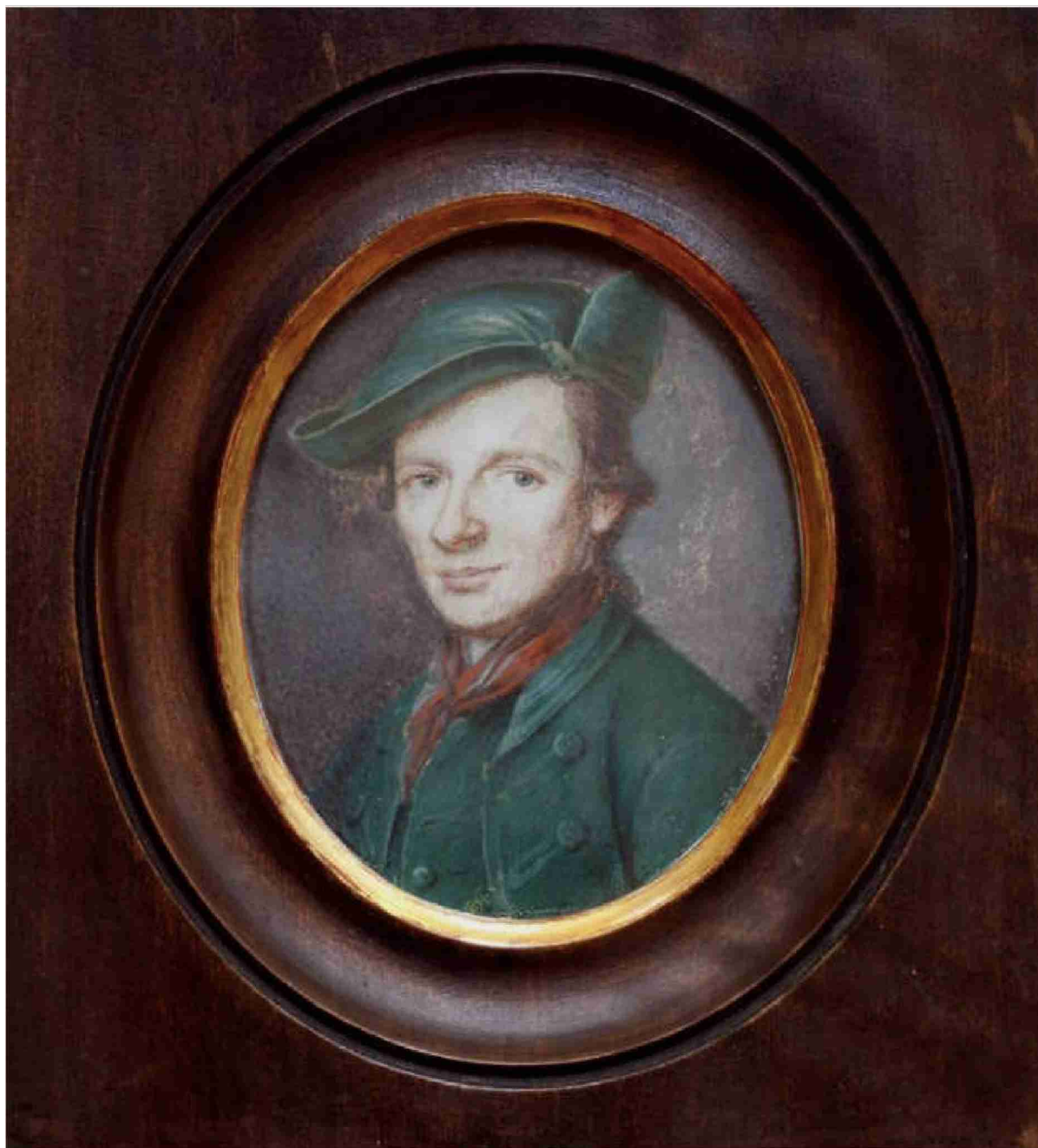
Caspar Wolf, Selbstbildnis mit aufgekrempten Hut, 1774