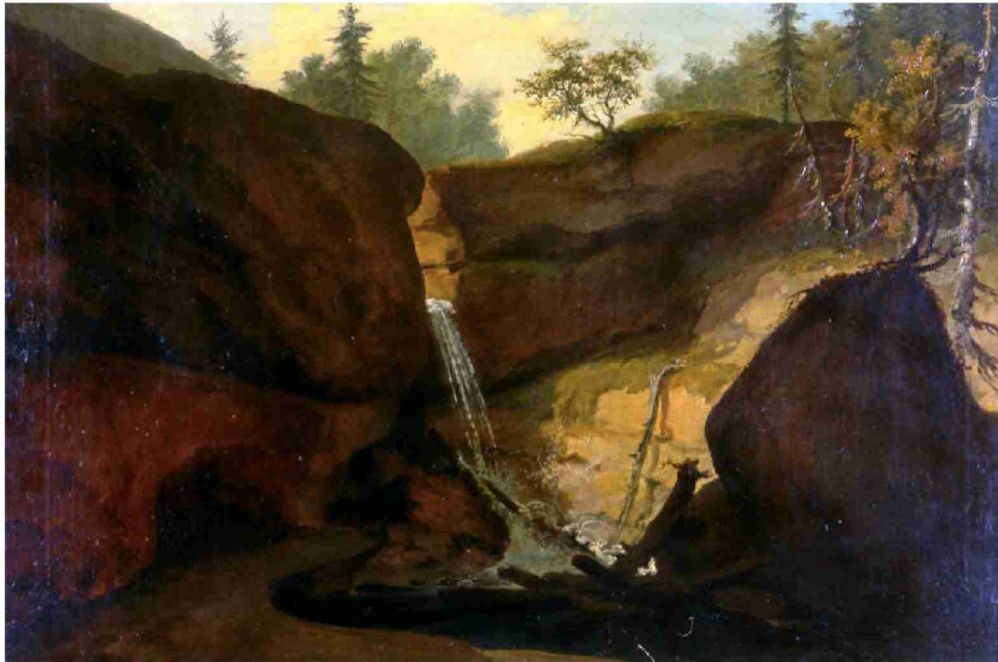
Wasserfall im Tobel bei Muri, nicht datiert (ca. 1777)