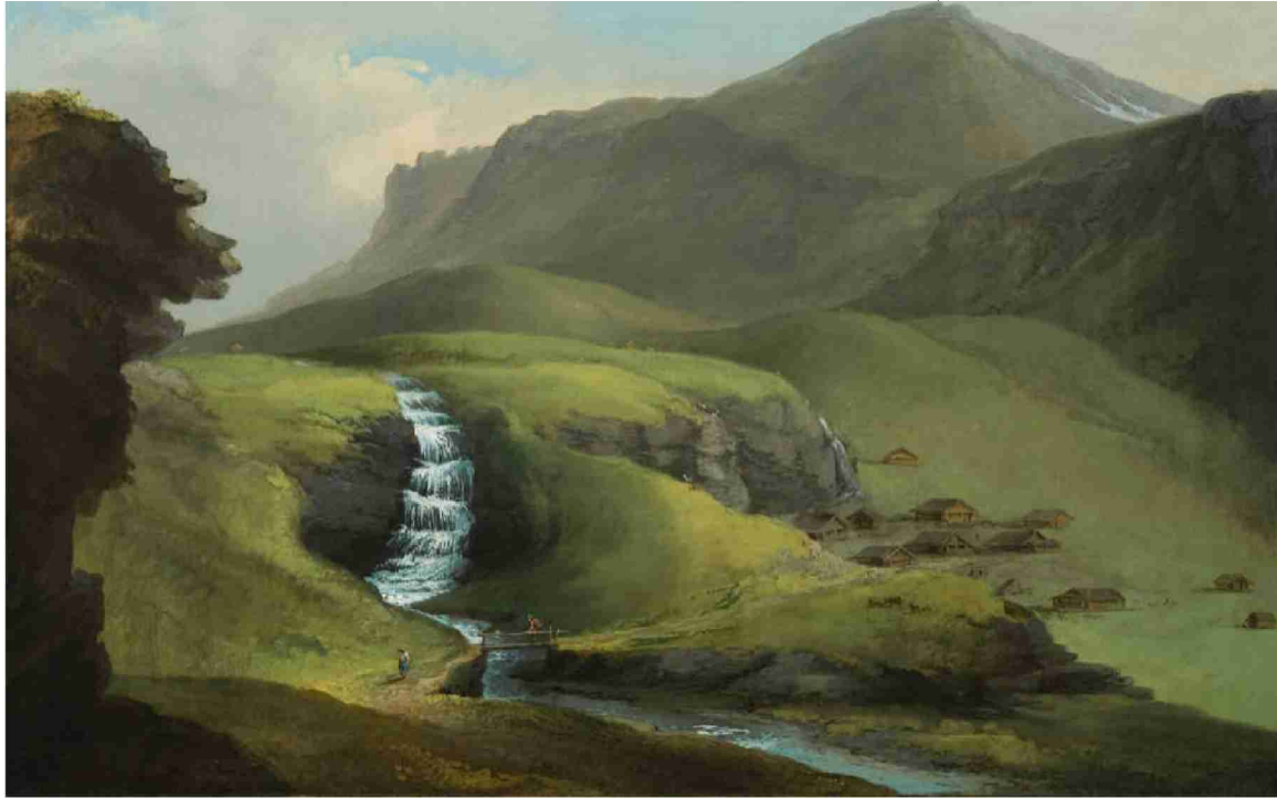
Oben: Bachalp ob Grindelwald, 1774/77 | Unten: La Grosse Pierre sur le Glacier de Vorderaar Canton de Berne Province d'Oberhassli, (1774/77)