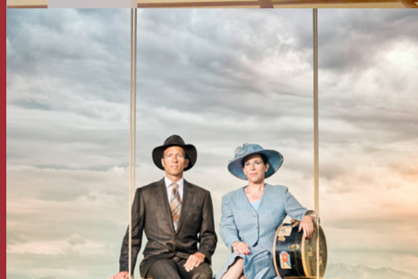
schön & gut