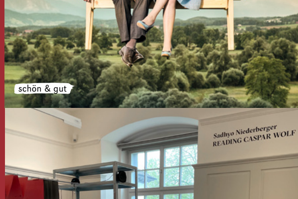
Reading Caspar Wolf