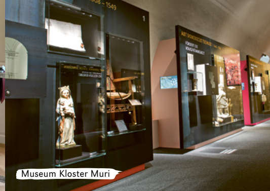
Museum Kloster Muri