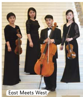
East Meets West