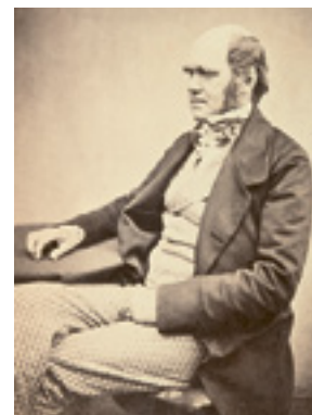
Charles Darwin (1809–1882) Fotografisches Portrait ca. 1859

Neue Wechselausstellung ab 3. November 2019