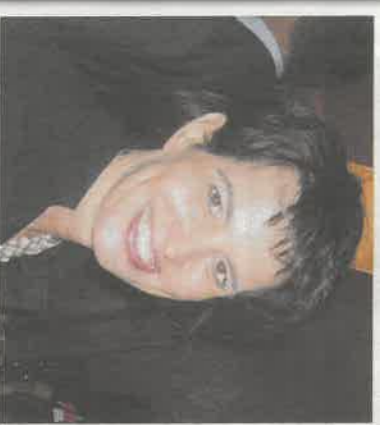
Doris Leuthard am Tag der Wahl.

Der 14. Juni 2006. Für das Freiamt, speziell für Merenschwand ist es ein denkwürdiger Tag. Doris Leuthard wurde in Bern als Bundesrätin ge-