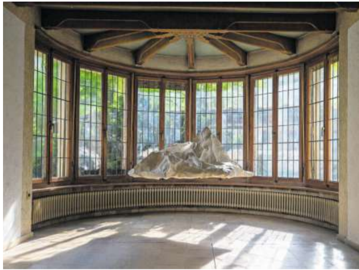
Ein schwebendes Massiv in der Villa Wild.

Seit Wolfs kunsthistorisch bedeutendes, jedoch lange ver-