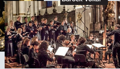
Ensemble Barock Vokal