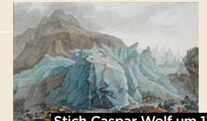
Stich Caspar Wolf um 1785