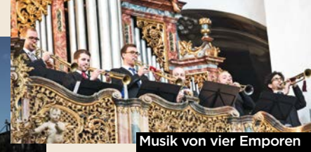
Musik von vier Emporen